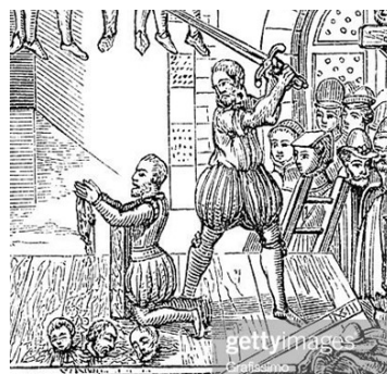
Décapitation à la Renaissance