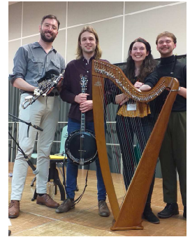
Le groupe irlandais Phoénix