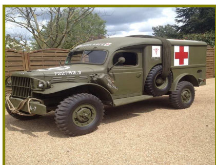
Dodge ambulance et Half track internationale de 1943, de nombreux autres véhicules seront présents à Joué le 12 mai.

De nombreux véhicules militaires seront présents et une exposition sera ouverte au public dans la mairie.