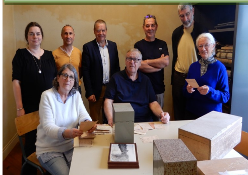
L'association classe et étudie les archives municipales.