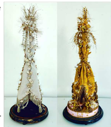
Quenouilles femme, homme